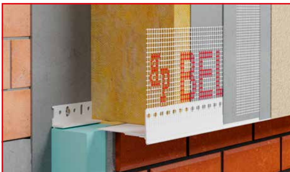
BP30 S LUX N COK