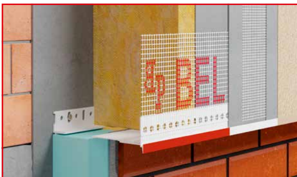
BP30 S PLUS N COK