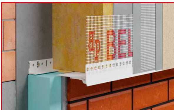
BP30 S LUX COK